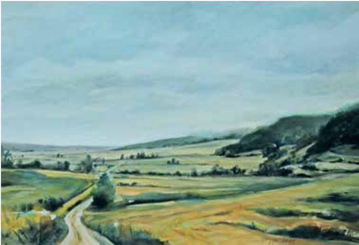
„Feld-Landschaft“, Irene Pregizer 2014, Acryl auf Papier, 50 x 70 cm

Das Tour-Paket haben die Initiative Kunst & Kultur Northeim und die Band gemeinsam geschnürt, zusammen mit den Akteuren der Veranstaltungsorte. Die Zielrichtung: Unterhaltsame, handgemachte amerikanische Musik im Stilmix Bluegrass, Blues und hawaiianischen Klängen wird gezielt in die Fläche gebracht. Dorthin, wo es schöne Veranstaltungsräume und Interesse vor Ort für solch einen Event gibt. Kultur soll es nicht nur in den Zentren geben, sondern auch im ländlichen Bereich und hier werden gezielt interessante Orte und Initiativen vorgestellt. Das ist seit Jahren auch das Bestreben der Northeimer Kulturinitiative, die seit ihrer Gründung 1979 in nunmehr fast 40 Jahren und mit über 500 Konzerten weit mehr als 50 Räume überall im Landkreis Northeim bespielt hat.