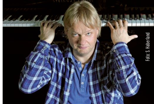
Klavier-Winter Bad Gandersheim

VV-Karten nur in Bad Gandersheim (Buchhandlung Pieper), Northeim (Papierus) und Göttingen (TonKost, Vaternahm) erhältlich!